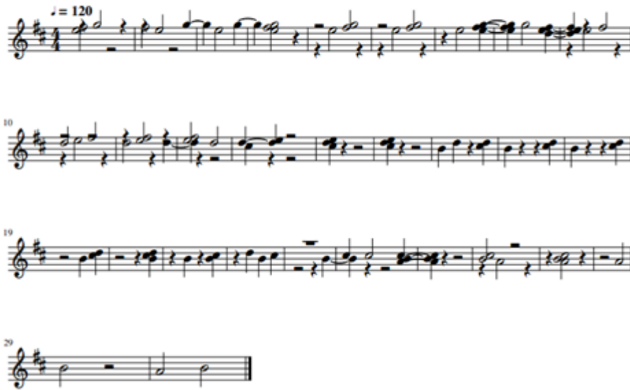
Abbildung 8: Generierte