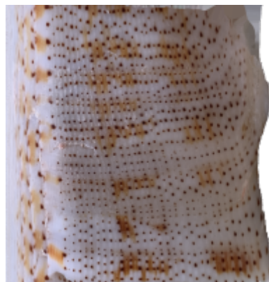
Abbildung 3: 2-D Textur C. nussatella

Die 3D-Textur wird mittels zylindrischer Netzprojektion in eine 2D-Textur umgewandelt (Abbildung 3). Dabei werden alle Schnecken in die gleiche horizontale Orientierung gebracht, sodass auch der Schnitt der Zylinder-projezierten Textur an der Lippe der Schnecke stattfindet, die keine Muster aufweist. Es entsteht eine quadratische PNG-Bilddatei.