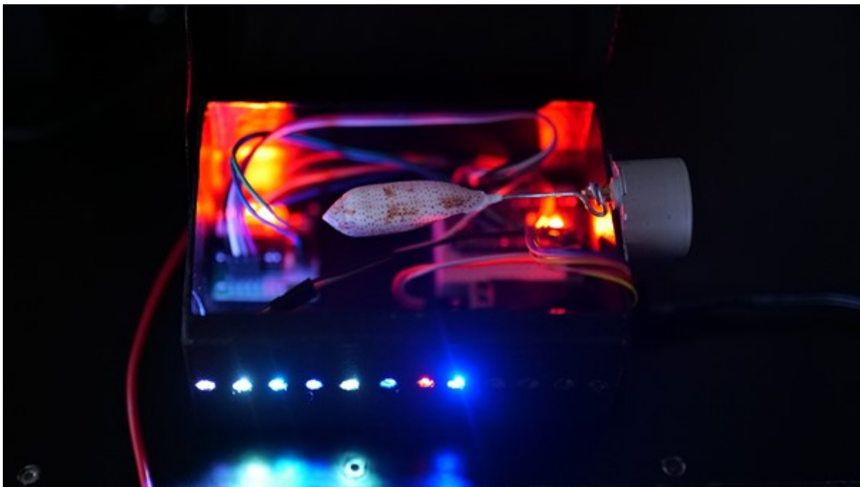
Abbildung 1: Aufbau der MuShell-Musicbox

Zur Präsentation des Projekts haben wir eigene Spieldosen gebaut. Diese drehen die Schnecke durch einen stepper Motor, der durch einen Arduino kontrolliert wird, während die Besucher die Vertonung des Musters durch Kopfhörer gespielt bekommen. Zusätzlich haben wir LEDs in der Spieldose montiert, die die erstellten Melodien periodisch wiedergeben.